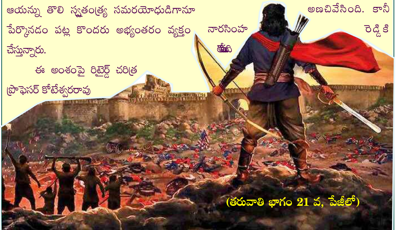
(తరువాతి భాగం 21 వ, పేజీలో)